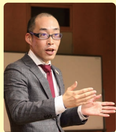
ジャイロ総合コンサルティング(株) 代表取締役