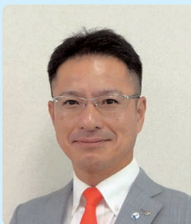
株UI志援コンサルティング 代表取締役

Webフォームからのお申込、 もしくは裏面の申込書を下記 宛先へFAXしてください。 商工会議所窓口でも受付して おります。