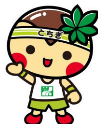
栃木県マスコットキャラクター 「とちまるくん」

栃木県産業技術センター繊維技術支援センター （担当：島田） 〒326-0817 栃木県足利市西宮町 2870 Tel：0284-21-2138 FAX：0284-21-1390